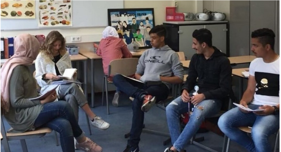
ISK Het Gooi leerlingen bespreken hun succesverhalen.

Nazorg en evaluatie zijn toegevoegd aan het programma van het MotivatieKompas®. Eerder is dat op beperkte schaal gedaan o.a. door een student van Hogeschool InHolland voor haar afstudeeronderzoek. Zij vond bij een steekproef dat 75% van de leerlingen die met een vervolgstudie waren gestart, een goede keuze hadden gemaakt dankzij het MotivatieKompas®.